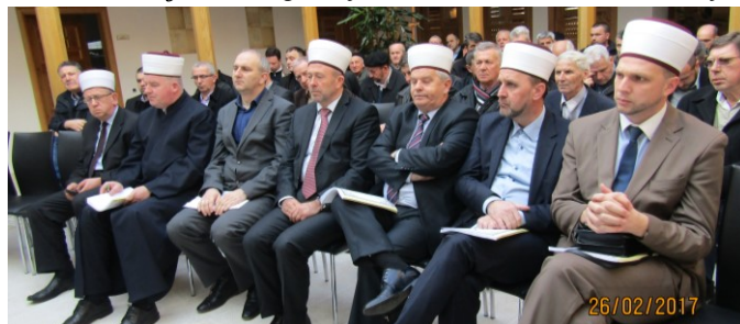
Prisutni gosti na sjednici Skupštine